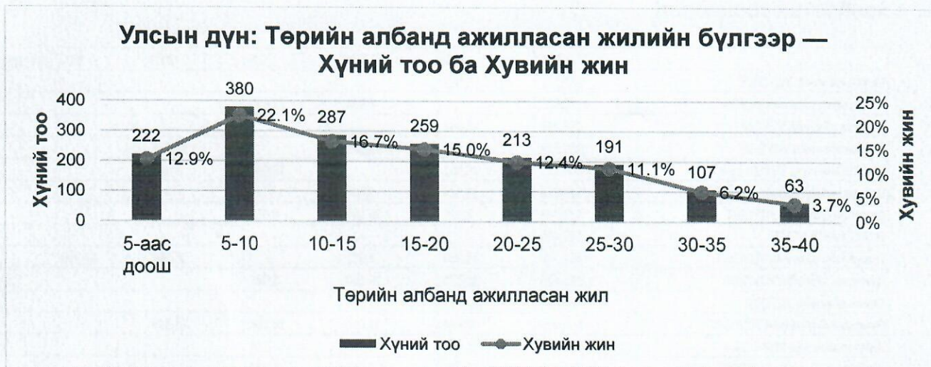
Зураг-1 Хүний тоо, төрийн албанд ажилсан жилийн харьцаа